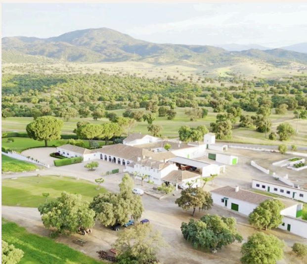
LA CASA AL AMANECER

Es una finca privada que se alquila en buyout completo para una boda. Sin público externo. Sin solapamiento con otros eventos. La finca, su casa y su dehesa son vuestras durante esos días.