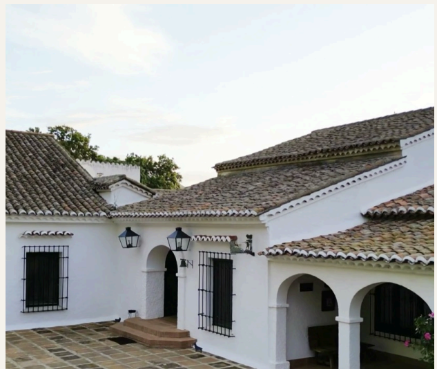
EL PATIO CASTELLANO