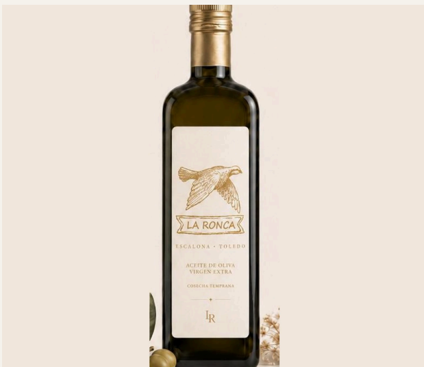
ACEITE VIRGEN EXTRA · CORNICABRA

El servicio incluye desayunos para los huéspedes alojados, almuerzo del día siguiente para los más cercanos, y una cena previa para la pre-boda si se desea.